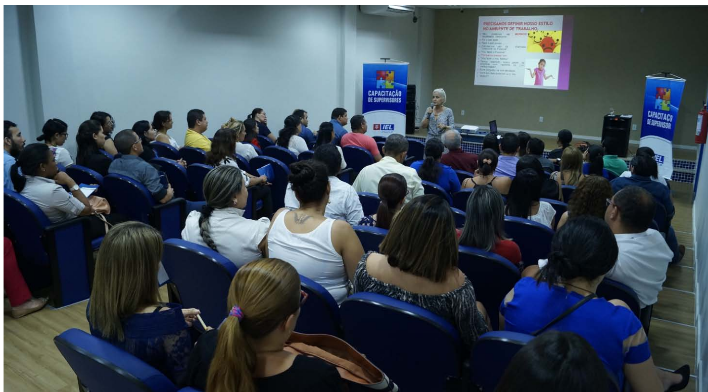
Participantes durante a capacitação de Supervisores de Estágio

O Instituto Euvaldo Lodi - IEL/RR realizou na manhã desta sexta-feira, 11 de novembro, em seu auditório, a 2ª Capacitação para Supervisores de Estágio com o tema “O Poder da Liderança Emocional”.