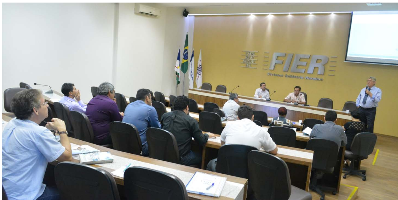
Membros dos Conselhos durante a 5ª reunião ordinária

As últimas reuniões ordinárias dos Conselhos Temáticos da FIER em 2016 aconteceram nos dias 01 e 03 de novembro no auditório da Casa da Indústria.