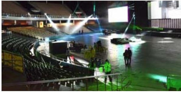
Ginásio Nilson Nelson, palco da abertura do evento